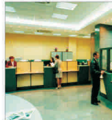
Creditarea în zona euro va fi dificilă în următoarele trei luni