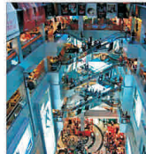
Invazie de mall-uri și mari centre comerciale în Arad