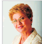
"Elmi Prodfarm" a fost preluată de "Sarantis"