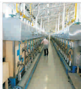
Cifra de afaceri a "Kendia-Excelent" la noua luni - peste 81 milioane de lei