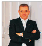
"Arctic" vrea să devină cel mai mare producător de frigider de la Europa Centrală și de Est