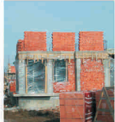
Producția "Vulturul" Comarnic este destinată pieței autohtone