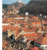
Investiție de 100 de milioane de euro pentru căldura Brașovului