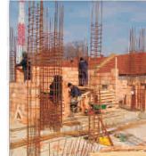
Boom-ul imobiliar a sporit vânzările "Holcim" cu circa o treime

Greșelile tale sunt o asigurare împotriva celor care se așteaptă să știi totul. Rex Stout