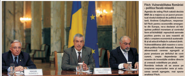
Guvernul BNR Mugur Isărescu (stânga) și-a exprimat încrederea, la finalul întâlnirii de lucru cu primul-ministru Călin Popescu Tăriceanu și cu ministrul Economiei și Finanțelor, Varujan Vosganian (dreapta), că, prin corelarea politicilor monetare cu cele bugetare, se va ajunge la corența necesară pentru respectarea țintelor propuse în 2008.

Executivul, în colaborare cu Banca Națională a României (BNR), va promova un mix de politici extrem de prudente, chiar dacă anul 2008 coincide cu un an electoral. 2008 va fi un an de chibzuită, iar majorările salariale și de pensii, care au fost asociate pomelilor electorale, s-au realizat în baza creșterii economice extraordinare din ultimii trei ani și nu au depășit posibilitățile economice ale țării". Potrivit premierului, în anul 2008, creșterile salariale efectuate de Guvern nu vor depăși productivitatea muncii și vor fi corelate cu evoluția inflației, printre-o mai bună coordonare a politicilor fiscale - bugetare cu politica monetară. Premierul a mai adăugat că salariale nu vor depăși anul actual al nivelului productivității, deoarece riscăm să provocăm creșterea inflației care va lovi în categoriile defavorizate. Anul acesta, salariile din educație și sănătate vor crește cu 11%, cele din armată și ordine