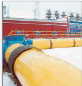
Nabucco își va alege furnizorii în acest an