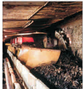
"BHP Billiton" și-a majorat oferta pentru prelucrarea "Rio Tinto"