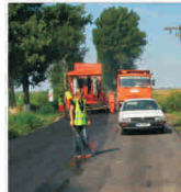
Consiliul Județean Arad continuă lucrările de modernizare a infrastructurii rutiere