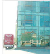
"Previ" întinde o creștere a vânzărilor de cel puțin 20%