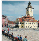
Asociația Metropolitană Brașov are în lucru 17 proiecte intercomunitare