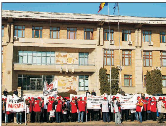
Sindicatul speră ca prin „Antibiotice” să „vîndce” AVAS de privatizările cu junghii...

Conducerea Autorității pentru Valorificarea Activelor Statului (AVAS) susține că va continua, conform calendarului, vânzarea companiei Antibiotice lași prin licitație publică, în ciuda deciziei Curții de Apel Iași care a admis cererea sindicatelor de a suspenda hotărârea de Guvern care stabilea metoda de vânzare.