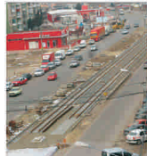
Primăria Arad va investi peste 20 milioane de euro în extinderea liniilor de tramvai