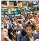
2007 - cel mai de succes an pentru Deutsche Boerse