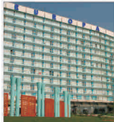
Unitățile "ANA Hotels" din Eforie Nord au obținut un profit brut de peste 4 milioane lei