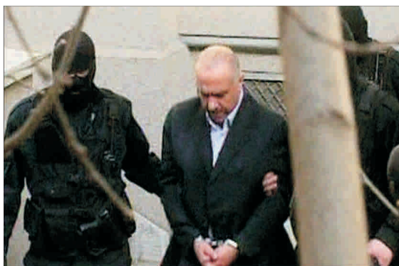
Legat, dar liber

Noi am plătit, iar Omar Hayssam, condamnat definitiv pentru terorism, a rămas liber, a rămas cu banii și face în continuare, liniștit, afaceri în țara noastră.