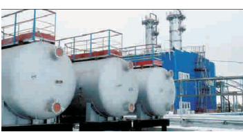
Ucraina amenință că va reduce livrările de gaze rusești către Europa

Compania petrolieră de stat ucraineană "Naftogaz" a amenințat, ieri, că ar putea reduce exporturile de gaze rusești spre Europa de Vest, dacă gigantul "Gazprom" continuă să taie livrările de profil destinate Ucrainei.