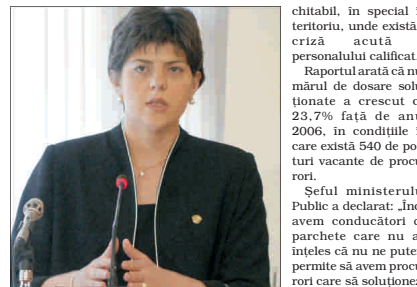
Laure Codruța Kovesi, Procurorul General al României