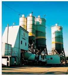
"Macofil" Târgu-Jiu - singura societate din zonă care fabrică produse ceramice tradiționale