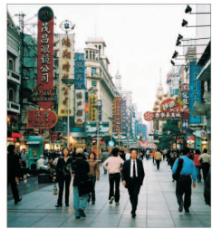
Investițiile străine directe în China au crescut cu 38% în februarie