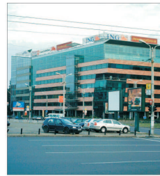
Randamentele investițiilor în birourile bucureștene mai scad cu până la un procent