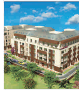
"Oci" construiește locuințe de 25 milioane de euro în zona Unirii din Capitală