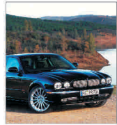
"Tata Motors" va plăti două miliarde de dolari pentru Jaguar și Land Rover