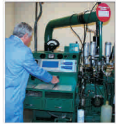
Anul trecut, circa 70% din producția "Badotherm-AMC" Veslui a fost exportată