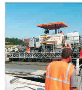
Lucrările la centura Timișoara, amânate până după jumătatea acestei luni

Interesul față de boală și față de moarte exprimă, de fapt, interesul față de viață. Thomas Mann