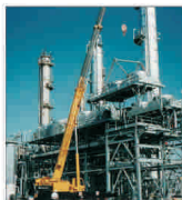
"Comes" Săvinești și-a propus o cifră de afaceri de peste 4,85 milioane de euro