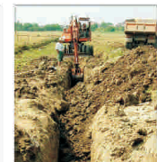
Peste 780 milioane de euro pentru modernizarea rețelelor de apă și canalizare din județul Iași

Dumnezeu e subtil, dar nu malițios. Albert Einstein