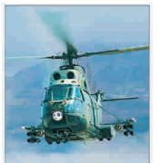
IAR Ghimbav - scoasă la privatizare...