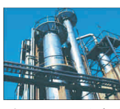
Compania petrolieră 'SOCAR' din Azerbaidjan este interesată să preia combinatul