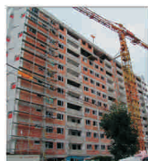
Prețurile apartamentelor noi din Iași au crescut ușor