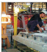
"Alro" - buget de investiții de 63 milioane de dolari