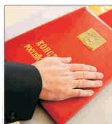
Noul președinte rus promite să lupte împotriva corupției și inflației