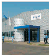
Producția de componente auto se extinde în tot mai multe localități din județul Arad