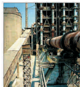
Vânzările totale de ciment au sporit cu 18%