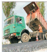
Peste 100 de milioane de lei pentru infrastructura Județului Timiș