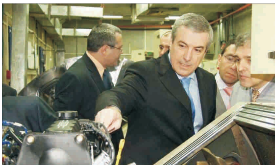
Cât ne va costa, în final, înlocuirea motoarelor Daewoo cu cele Ford la Craiova?