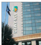
"Deutsche Bank" și BNP sunt interesate de unele active ale ABN