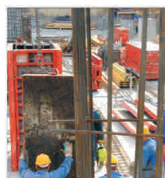
15 cartiere noi pe fostele fabrici bucureștene