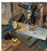
Un fond de investiții german vrea activele "Rulmentul" Brașov