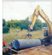
"Aquatim" investește 18 milioane de lei în infrastructura din Timiș

Numai un om deștept poate deveni cinic; numai un om înțelept este înțelept să nu o facă. Fannie Hurst