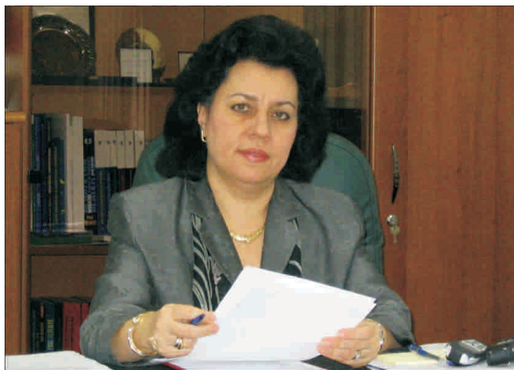
CNVM a impus rigori cărora SIF-urile nu le găsesc rostul. (În fotografie, președintele CNVM, Gabriela Anghelache)

Câteva sute de mii de euro vor trebui să scoată societățile de investiții financiare din buzone pentru a reuși să îndeplinească, până la 31 august, exigența Comisiei Naționale a Valorilor Mobiliare să prezinte bilanțurile consolidate pe 2007.