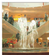
România ocupă locul 4 în Europa la proiecte de centre comerciale