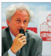
Generali Asigurări își propune o creștere anuală a primelor brute subscrise de 19%