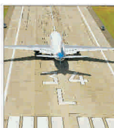
"Alitalia" necesită finanțare de urgență