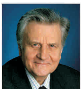
Lipsa de transparență - vinovată de turbulențele de pe piețele financiare