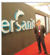
"Cersant" investește masiv la Roman