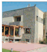
Cea mai scumpă vilă scoasă la vânzare costă peste patru milioane de euro