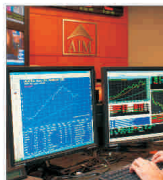
Vânzările de obligațiuni scad simțitor