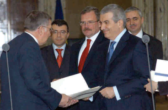
Statul nu se grăbește să se retragă din Fondul Proprietatea, astfel că nu este interesat nici de cine reprezintă Fondul în companiile din portofoliu, aflate și ele, majoritatea, tot sub controlul statului (Ceremonia de înmânare a primelor acțiuni la "Fondul Proprietatea" - Palatul Victoria).

Cel mai mare afa- cere controlată încă de statul român rămâne Fondul Proprietatea, care după aproape trei ani de la înființare nu a reușit să împartă decât aproape 18% din capitalul social către cei în drept să fie despa-