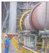
Cifra de afaceri de 25.316.000 lei pentru "Lafarge Agregate Botoane"