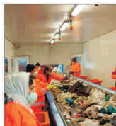
Italianii de la „Caboto” vor investi 40 milioane euro în Chișineu Criș