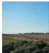
EUROMETROPOLA: Terenurile agricole metropolitane - o mină de aur pentru investitori