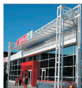
"Spar" vrea să deschidă încă 12 supermarket-uri în țara noastră