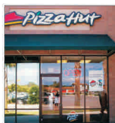
Franciza - un fenomen global