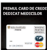
PRIMUL CARD DE CREDIT DEDICAT MEDICILOR