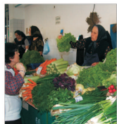
Liderii G8 - îngrijorați de creșterea prețurilor alimentelor și petrolului