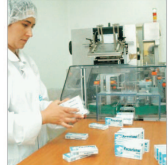
GSK mută la Brașov producția unor medicamente