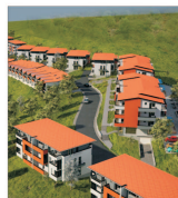
"Omnia Residence", proiect imobiliar de peste 19 milioane de euro