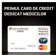
PRIMUL CARD DE CREDIT DEDICAT MEDICILOR