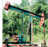
AIE își modifică în creștere estimările privind cererea mondială de petrol