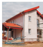
Regatta: o locuință pentru cinci cereri în București

În tot ce faci, gândește-te la sfârșit La Fontaine