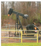
Marii petrolisti ruși - anecheți pentru fixare de prețuri

Vânzări/cumărări acțiuni FONDUL PROPRIETATEA ultima pagină din supliment. Preluăm anunțuri gratuit la telefon 021/3138707, pe email anunțuri@bursa.ro și prin poștă, pe couponul BURSA