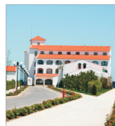
"Tracoin" a investit 32 de milioane de euro într-un complex din Mamaia Nord