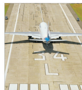
Companiile aeriene din Rusia ar putea fi obligate să rezilieze contractele pentru combustibili