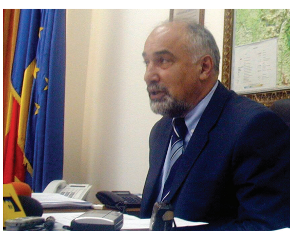
Titlurile de stat vor fi listate la Bursa de Valori București (BVB) săptămâna viitoare, după cum ne-a informat ministrul finanțelor, Varujan Vosganian...