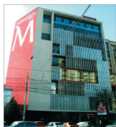
Millennium Bank a înregistrat o creștere a activelor de 150%