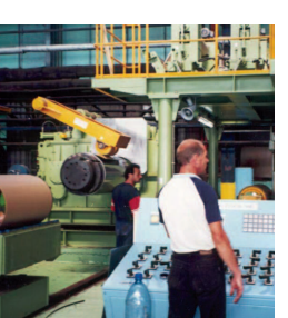
pol și procurorilor din țară să urmărească cu atenție deosebită compania "Mechel", care, în primul trimestru din 2008, "a vândut materii prime în exterior la prețuri de două ori mai mici decât cele de pe piața internă".

Compania minieră rusă "Mechel" a fost dur criticată, săptămâna trecută, de premierul Vladimir Putin, ceea ce îi determină pe unii observatori ai pieței internaționale și pe investitori să se întrebe dacă nu cumva suntem în fața unui nou caz "Iukos" - gigantul petroler falimentat de autoritățile de la Kremlin pentru a putea intra în proprietatea unei companii de stat.