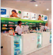
"Centrafarm" și-a majorat vânzările cu 76%