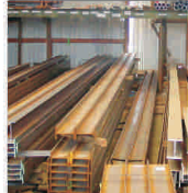
Autoritățile antitrust din Rusia deschid ancheta la "Evraz" și "Raspudskaya"