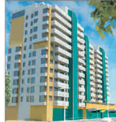
"Privilege", un nou ansamblu rezidențial în Galați cu 168 de apartamente

Universul este un cerc al cărui centru e circumferința, iar circumferința nicăieri. Pascal