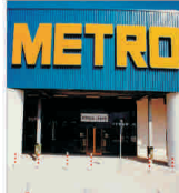
"Metro" are pierderi de 246 milioane de euro