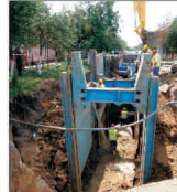
Primăria Arad a început introducerea canalizării cu bani de la Banca Mondială