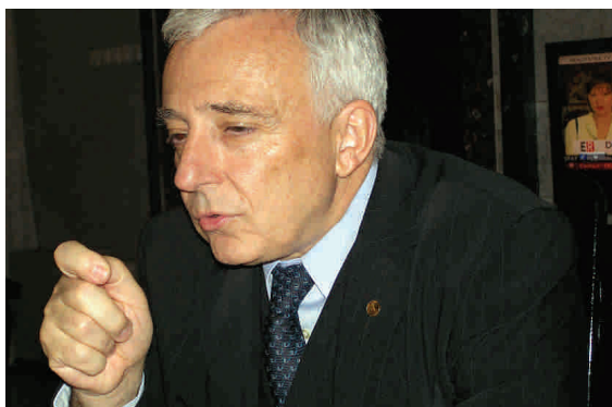
Dobânda de politică monetară - doar un picuș mai mare

Presiunile inflaționiste se mențin și în a doua jumătate a anului