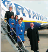
Ryanair s-a retras, Blue Air vine cu o cursă nouă pe Aeroportul din Arad

Vanzări/cumpărări acțiuni FONDUL PROPRIETATEA ultima pagină din supliment. Protejam anunțuri gratuit la telefon 021/3138707, pe email anunțuri@bursa.ro și prin poștă, pe couponul BURSA