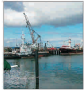
"Aler Braemă" va livra 17 nave, anul acesta