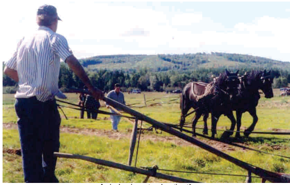
Acțizea la cai nu este subvenționată.

• În timp ce fermierii contestă noul preț redus al motorinei, 4.000.000 de mici agricultori sunt declarați neeligibili