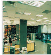
"China Development" și "Commerzbank" - rivali în lupta pentru "Dressner"?