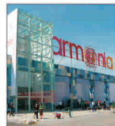
Mail-urile scumpe apartamentele, la Arad

Unui om plin de curaj nimic nu îi este cu neputință. Jacques Coeur