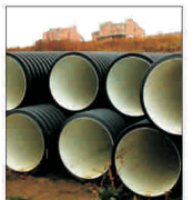
Profit net de 777.000 lei pentru 'Prodplast' București