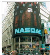
Nasdaq câștigă semnificativ din achiziția OMX