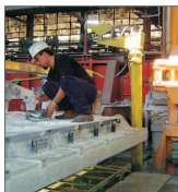
Afacerile "Alro" Slatina au atins 1 miliard de lei

Vânzări/cumărări acțiuni FONDUL PROPRIETĂȚII ultima pagină din supliment. Prețului acțiunilor grațiat la telefon 021/3138707, pe email anunțuri@bursa.ro și prin poșta ne electronica BURSA