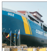
Cea mai sofisticată navă construită la Galați, lansată cu două luni întârziere