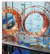
"Mechel" a încălcat Legea concurenței