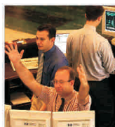
Italia va avea piață alternativă de acțiuni