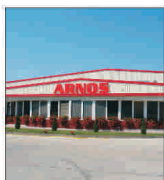
"Arnos" vrea să devină lider pe piața pastelor făinoase

Vânzări/cumărări acțiuni FONDUL PROPRIETATEI ultima pagină din supliment. Prețurile anunțuri gratuite la telefonul 021/3138707, pe email anunțuri@bursa.ro și prin poșta pe eponenul BURSA