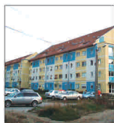
Carier ANL cu 100 de apartamente, în estul Municipiului Arad