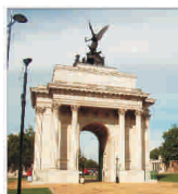
Economia Marii Britanii se apropie de recesiune