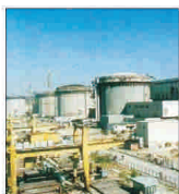
Profit mai mare cu 45% pentru 'Nuclearelectrica'