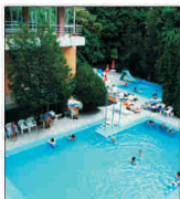
Veniturile din exploatare au crescut cu 13% la compania "Turism Felix" SA

Vânzări/cumărări acțiuni FONDUL PROPRIETĂȚII ultima pagină din supliment. Prețului anunțuri prin telefon 021/3138707, pe email anunțuri@bursa.ro și prin poșta ne electron BUBSA