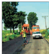
Un drum prost modernizat din județul Arad este refăcut pe banii constructorului