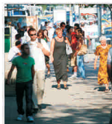
Cețenii UE: Guvernele naționale sunt vinovate pentru situația economică nefavorabilă a Europei