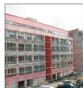
Aradul va avea încă 5.000 de apartamente noi

Clipa este pretioasă, ca viața unui om. Schiller