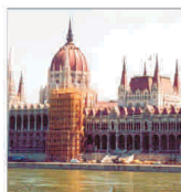
Premierul ungar propune reducerea taxelor cu 4,7 miliarde euro pentru a stimula creșterea economică