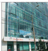
ProCredit Bank, profit net de 250 de mii de euro