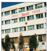
„Ușei” Târgoviște a trecut pe profit, pe fondul unor afaceri în creștere

Vânzări/cumărări acțiuni FONDUL PROPRIETATEA ultima pagină din supliment. Prețuri anunțuri gratuite la telefonul 021/3138707, pe email anunturi@bursa.ro și prin poșta ne electronica BURSA