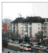
Românii care muncesc în Occident au dezamorsit piața imobiliară arădeană