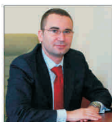
În 2008, piața telecomunicațiilor va crește doar cu o cifră

Vânzări/cumpărări acțiuni FONDUL PROPRIETATEA ultima pagină din supliment. Preluăm anunțuri gratuit la telefon 021/3138707, pe email anunțuri@bursa.ro și prin poșta, pe cuponul BURSA