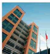
Preluarea Zenitva este posibilă în următorii trei ani