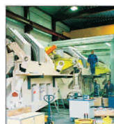
„ArelorMittal Construction” România a realizat 22 de hale industriale