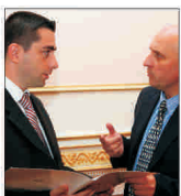
"Boștină și Asociații": Crește concurența pe piața avocatilor de business