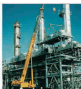
Kazahstanul mizează pe o producție de 70 milioane tone de petrol, în 2008