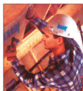
"Knauf Insulation" mizează pe o cifră de afaceri de 7 milioane de euro în primul an de activitate în România