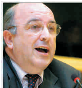
Joaquin Almunia a avertizat asupra posibilei spirale inflaționiste în Europa