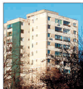
Reabilitarea termică a blocurilor se va derula mai repede

Cei mai mulți nu doresc libertate, pentru că libertatea implică responsabilitate. Freud