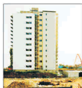
'Seven Hills' a planificat investiții de peste 650 de milioane de euro în construcția de locuințe