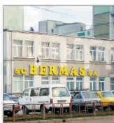
Afaceri de 9.84 milioane lei pentru 'Bermas' Suceava, pe primul semestru

Vânzări/cumărări acțiuni FONDUL PROPRIETATEA ultima pagină din supliment. Prețurile anunțuri la telefon 021/318707, pe email anunturi@bursa.ro și prin poșta pe exemplul BURSA