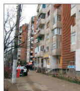
Începerea școlii a scumpit chiria apartamentelor din Arad, cu peste 25%

De teama vrăbiilor nu trebuie să renunți la semănatul cănepii. Cervantes