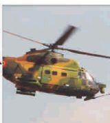
"Aero Vodochoy" se luptă cu "Marcovici Capital Limited" pentru IAR Ghimbav

Despre anumite companii PROHIBIT în este ziarul "BURSA" să publice informații