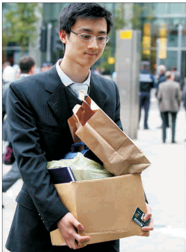
Unul dintre angajații "Lehman Brothers" părăsește, cu tot cu lucrurile sale, sediul sucursalei din Londra aparținând băncii americane de investiții.