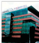
ING nu cumpără operațiunile "ABN Amro" din Olanda

Despre anunțurile companiilor PROHIBIT ÎN ESTE ZIARUL "BURSA" SA PUBLICE INFORMAȚII