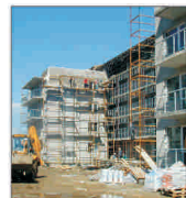
Compania pentru construcții "Alex" SRL își inițiază un proiect imobiliar de 7,5 milioane euro