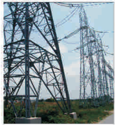
Producătorii privați de energie din Rusia cer credite guvernamentale