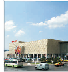
Prima fază a lucrărilor de extindere a Iulius Mall Iași s-a finalizat