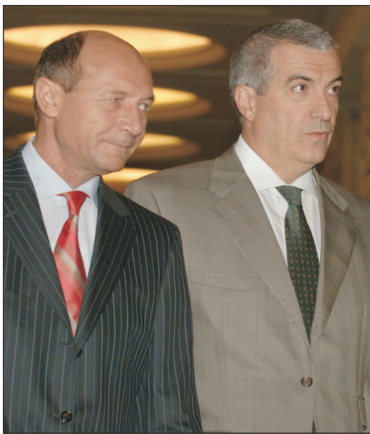
Scăderea ratingului țării noastre, prețul plătit într-un an electoral!