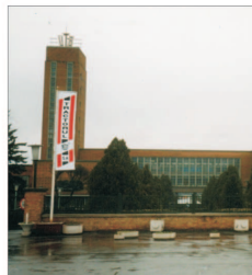
La Roman SA se vor produce tractoare

Vânzări/cumpărări acțiuni FONDUL PROPRIETATEA ultima pagină din supliment. Preluăm anunțuri gratuite la telefon 021/3138707, pe email anunturi@bursa.ro și prin poștă pe cuponul BURSA