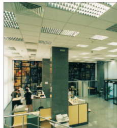
"Mitsubishi UFJ" își majorează capitalul cu peste 10 miliarde de dolari