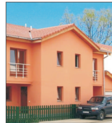
Doă produse noi pentru achiziția locuințelor „Impact Developer&Contractor”