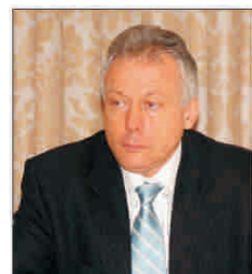
Buget de 3,4 miliarde de lei pentru Ministerul Dezvoltării

O singură clipă poate schimba totul. Wieland