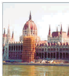
Ungaria primește finanțare de 20 miliarde euro